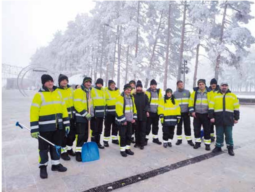
Тим Службе чистоће КЈП Златибор