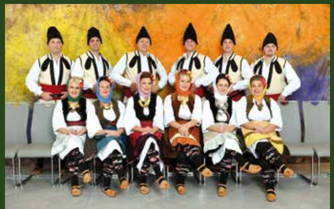
Удружење за неговање народне традиције Златибор, Чајетина

Наше удружење на репертоару има игре из Врањског поља, из Мачве, из Централне Србије, Гњилана, Лесковца, наравно игре златиборског краја. За следећу годину планирана је турнеја по Италији, Бугарској, Охриду, Грчкој, као и традиционални наш летњи концерт на Краљевом тргу на Златибору - наводи Весовић. Осим угођаја за туристе и мештане, овакви видови манифестација доприносе и туристичкој привреди Златибора, а организација је веома добра, за шта смо захвални Оштини Чајетина, Туристичкој организацији, Туристичко - рекреативном комплексу, као и целој туристичкој привреди.