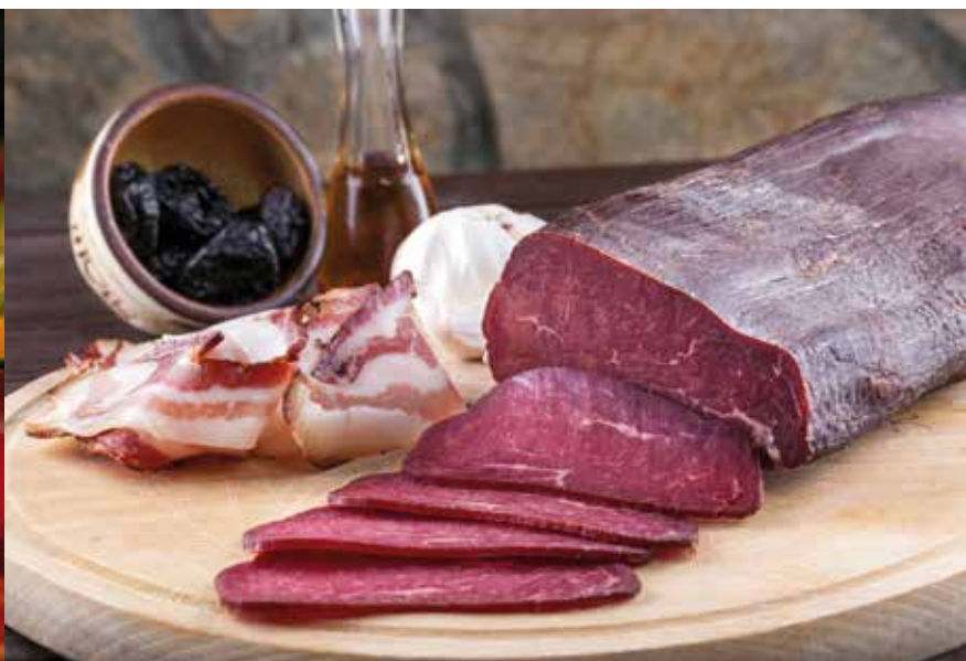
Сајам сувомеснатих производа Пршутџада