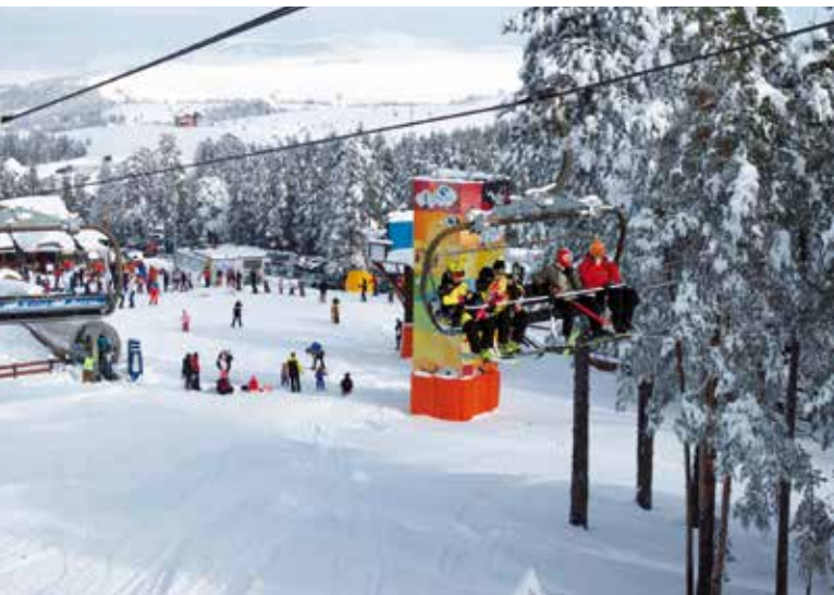
Отворена ски сезона на Торнику

Златибор нуди посетиоцима прилику да истраже бројне локалитете на планини, која је прави рај за рекреацију и уживање. Туристи могу уживати у срцу златиборске традиције – Музеју Сѓаро село Сурогојно , истраживати понос спелеологије – Стопића пећину, доживети свет авантуре у Дино ѓарку и Авантура парку, осетити дух Запада, спојен са аутентичним вредностима нашег краја, у Ел Пасо Ситију , уживати у лепотама Гостиљског водопада, а ту су и многе друге атракције које овај крај нуди.