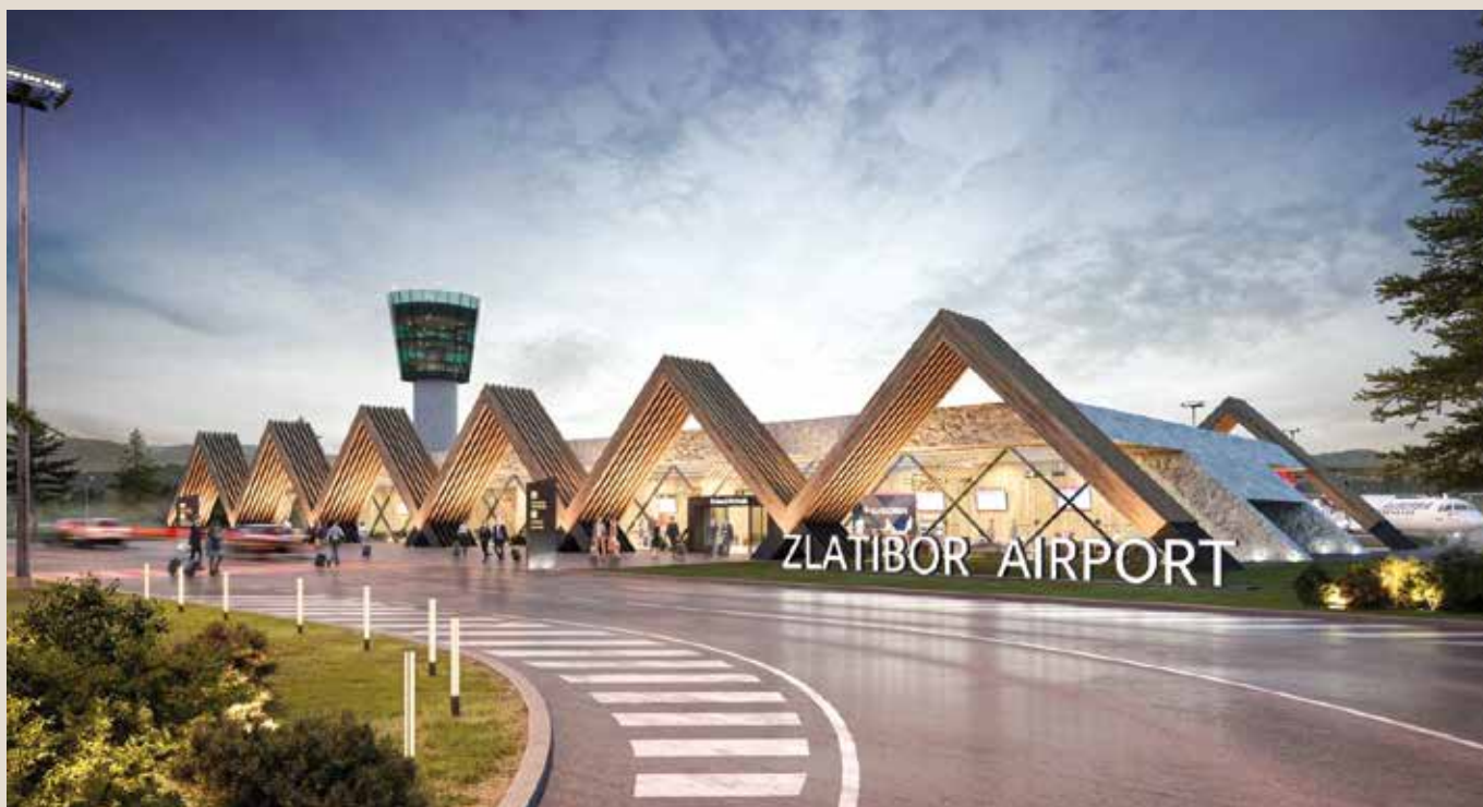
Идејно решење, аеродром Златибор

Кратким освртом на добро познату статистику, подсећамо да је у периоду од јануара до јула прошле године остварено 543.977 ноћења домаћих туриста, што представља раст од 17%, док је број ноћења страних туриста порастао на импресивних 37%.