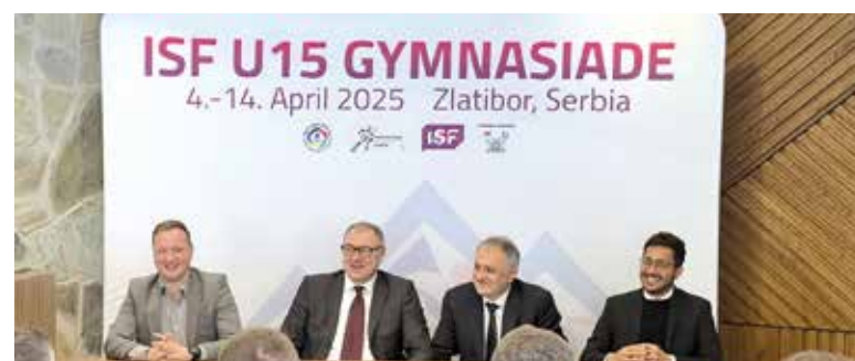
Конференција за новинаре, Хотел Златибор

Школаријада представља кључни тренутак у промоцији Златибора и Србије на светској спортској мапи, а окупљање младих спортиста из целог света пружа прилику за афирмацију спорта и здравих вредности међу младима.