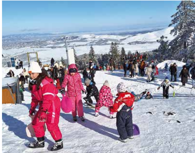
Игре на снегу, врх Торника

Као друштвено одговорно предузеће континуирано подржавамо локално и женско предузетништво. Из те идеје настале су услуге Бранч у ваздуху и Романтично љубовање , као јединствени концепт угођаја у кабинама гондоле. Кроз Бранч у ваздуху смо спојили аутентичне златиборске специјалитете, које набављамо од локалних произвођача: домаћа пита, пршута, чвращи, кајмак, до-