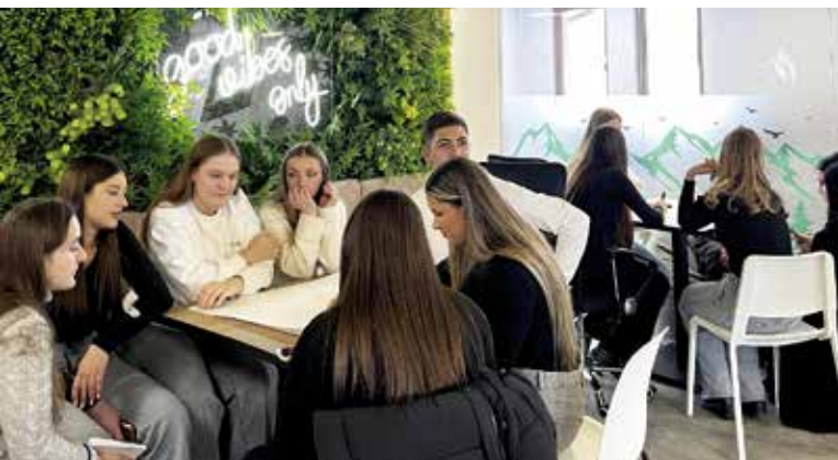
Посета средњошколаца из Тутина Канцеларији за младе на Златибору

Недавна посета средњошколаца из Тутина и радионица 'Траг добра' сведоче о важности волонтеризма и активизма, али и о томе како овакви програми доприносе личном и професионалном развоју младих. Кроз будуће пројекте, настављамо да доприносимо како унапређењу квалитета живота младих, тако и развоју туризма на Златибору, претварајући овај регион у центар омладинских иницијатива и позитивних промена, изјавили су координатори ове канцеларије.