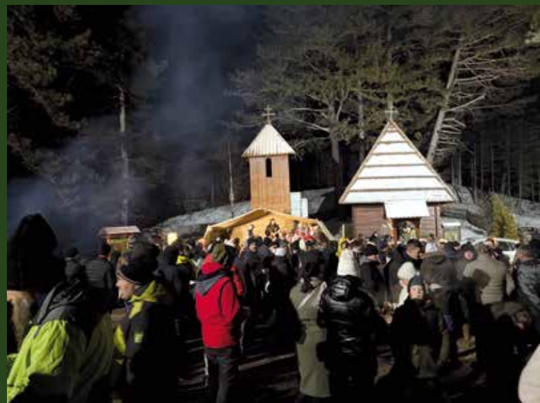
Дочек Православне нове године у духу традиције у Јабланици

Дочек Православне нове године у духу традиције одржан је у Јабланици, док је дочек обележен и на Краљевом тргу у ритму сјајног провода уз певачицу Секу Алексић. Разноврсни догађаји обележили су почетак године на Златибору, док је недеља, 19. јануар, била у знаку Медитерана, Херцег Новог и препознатљивог симбола јужних крајева – мимозе. Караван 56. Празника мимозе гостовао је на Краљевом тргу, где су мажореткиње, тромбоњери и чланови машкара продефиловали пешачком зоном, а затим наступили у оквиру промоције ове чувене манифестације.