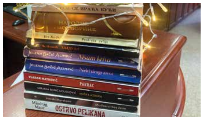
Књишка издања Лагуне , нови наслови у библиотеци