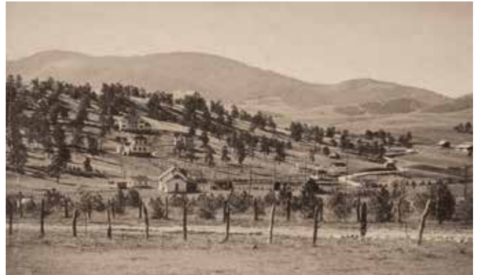
Златибор некад •