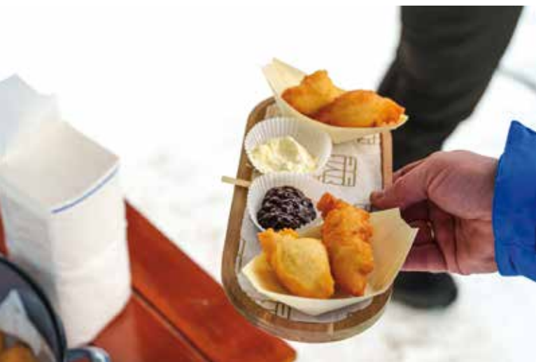
Планински залогаји на врху Торника

Ови специјалитети не само да су разбудили чула, већ су и подсећали на топле и пријатне тренутке из детињства, што је дало додатни шарм зимском ис-