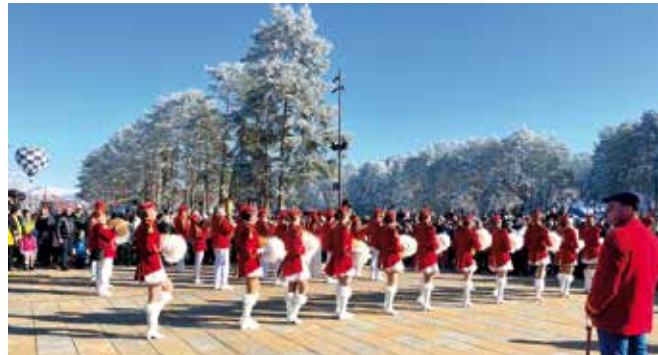
Златибор домаћин Каравана 56. Празника мимозе