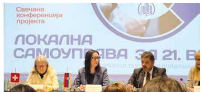
Свечана завршна конференција пројекта Локална самоуправа за 21. век

Догађај је завршен у позитивној атмосфери, уз јасно дефинисане смернице за наставак сарадње и даљи напредак локалних самоуправа широм Србије.