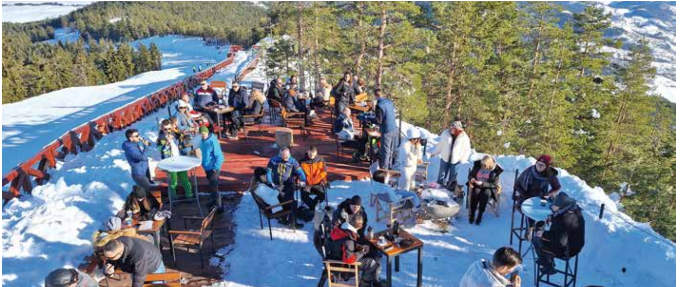
Зима за ѝричу на врху Торника

Током целе године пажљиво ослушкујемо тржиште и пратимо трендове у свету. У том креативном процесу долазимо увек до нових идеја, али се држимо основне замисли – савремени концепт забаве у природи за све генерације путника. Доласком на гондолу посетиоци постају део наше заједнице, која током целе године нуди бројне садржаје за све генерације.