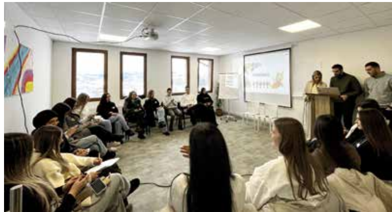
Радионица Траг добра

Кроз пројекат 'Млади заједно', омогућили смо бројне појаве за 458 младих са територије општине и на овом пројекту планирамо да радимо и у будућности. Поред тога, у плану су радионице, неформално образовање и сарадња са канцеларијама за