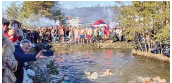
Богојављење 2025. године

Надметања и трке није било, већ су се сви учесници, који су успели да допливају до Крста, истакли као најбољи. Овај догађај привукао је велики број верника, који су се састали на обали реке да подрже храбре момке и девојке, и уживају у чарима које овај празник пружа.