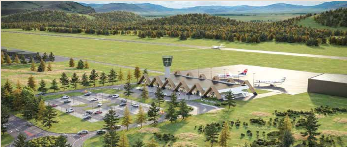
Идејно решење, аеродром Златибор

Овај континуирани раст позиционира Златибор као дестинацију са највећим порастом броја ноћења страних туриста у земљи, што указује на огроман потенцијал за додатни напредак и нови искорак - изградњу аеродрома и долазак високопрофилних гостију укључујући и кориснике приватних летова. Несумњиво, осим туристичког потенцијала, Златибор може бити значајан и за шири економски развој, а реализација пројекта аеродрома на Златибору замишљена је као дугорочан и стратешки инфраструктурни подухват.