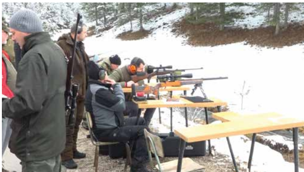
Ловци на стрелишту

Другог дана саборовања, такмичарски расположени учесници, одмерили су своје способности на стрелишту Трчинога приликом гађања покретне и непокретне мете вука и срндаћа и глинених голубова, као и непокретне кружне мете на 200м и 300м.