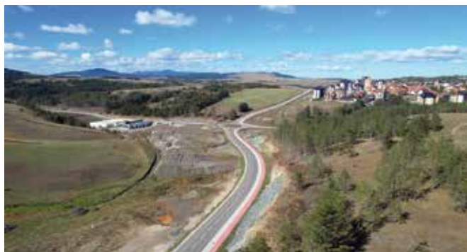
Обилазница око Златибора

„Изградња обилазнице је почета пре неколико година и урађен је део који веже државни пут за Црну Гору и насеље Око. Са државом треба да потпишемо уговор за даљу изградњу до Бранежаца где ће бити будућа петља ауто-пута и где ће се сви они гости који долазе на Златибор моћи безбедно и брзо да се искључе, као и да брзо дођу на Златибор. На тај начин решавамо улазак на Златибор, на кружном току, где долази највећи број гостију. Изградњом обилазнице ћемо растеретити саобраћај, један број возила ће моћи да оде ка Црној Гори без проласка кроз главни кружни ток, а други део ће моћи да иде према Београду, односно ка Босни и Херцеговини преко насељеног места Бранешци где ће бити петља за искључење будућег ауто-пута, а пре тога на постојећи магистрални пут који иде ка граничном прелазу Котроман“, каже Рајовић.