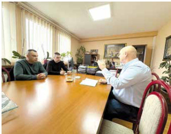
Радни састанак са колегама из Чачка