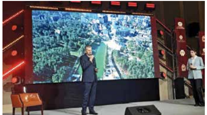
Златибор се представио у Москви

Девети Global Cultural Diplomacy Forum представља међународну платформу која окупља лидере из области политике, дипломатије, бизниса, културе и инвестиција, са циљем унапређења културне дипломатије и јачања међународне сарадње. Форум је усмерен на изградњу партнерстава између држава кроз културну размену, повезивање културе са економијом и инвестицијама, као и подстицање дијало-