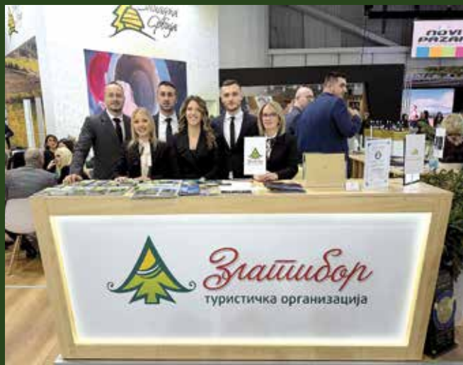
ТО Златибор на Сајму туризма

се представио у оквиру заједничког штанда Туристичке организације регије Западна Србија.