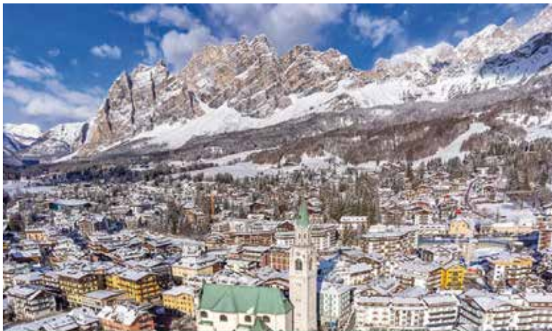
CORTINA D'AMPEZZO, ИТАЛИЈА

Cortina је данас елитна дестинација. Њен луксуз није настао преко ноћи. Настао је инвестицијама, планирањем и визијом. Данас је симбол престижа. Некада је била мало планинско место.