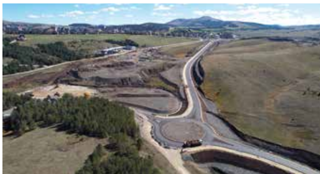
Радови при крају