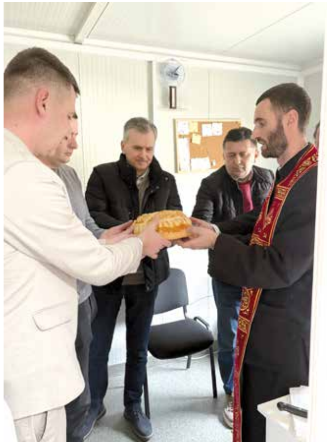
Слава ЈП Зоохигијене

Поред радних активности, колектив ЈП „Зоохигијене” Чајетина недавно је обележио и своју славу, Света Три Јерарха, чиме је још једном потврђена важност заједништва, традиције и међусобне подршке унутар колектива. Обележавање славе представља прилику да се сумирају резултати рада, али и да се додатно учврсте вредности на којима се темељи свакодневно деловање – одговорност, хуманост и посвећеност заједници.