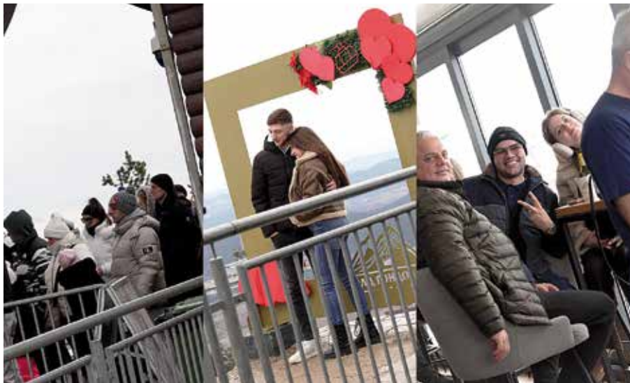
Дан заљубљених на гондоли

„Голд гондола је данас један од симбола Златибора и незаобилазна атракција за туристе који желе да планину доживе из другачије перспек-