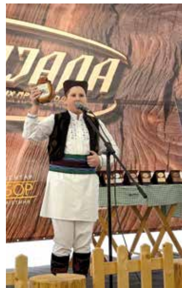
Млади здравичар поздравео присутне

Манифестацију су организовали Златиборски еко аграр и Удружење произвођача сувомеснатих производа Златиборског округа, уз значајну подршку Културног центра Златибор, Иновационог бизнис центра Златибор и Туристичке организације Златибор, док је покровитељ догађаја Општина Чајетина.