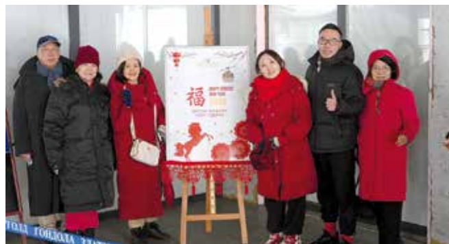
7.000 Кинеза посетило Златибор

Циљ оваквих активности је да се кинеским туристима додатно приближи Голд гондола као незаобилазна атракција Златибора и најдужа панорамска гондола на свету, као и да се кроз пажљиво осмишљене програме подстакне даља промоција на овом тржишту и развија међукултурна сарадња.