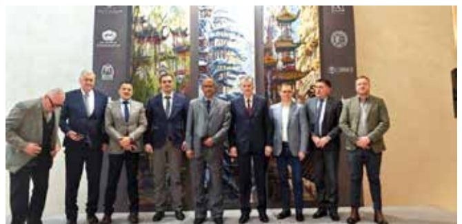
Делегација Чајетине у Русији