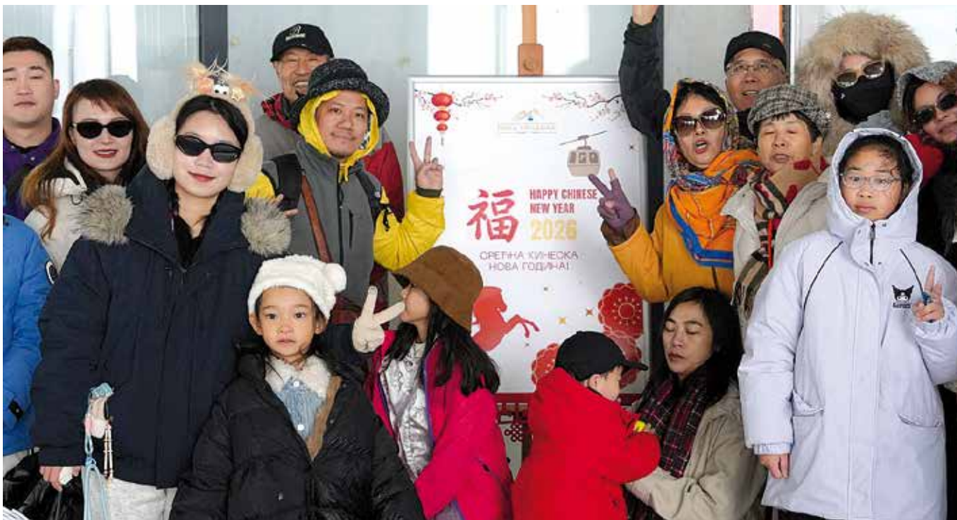
Прослава Кинеске Нове године