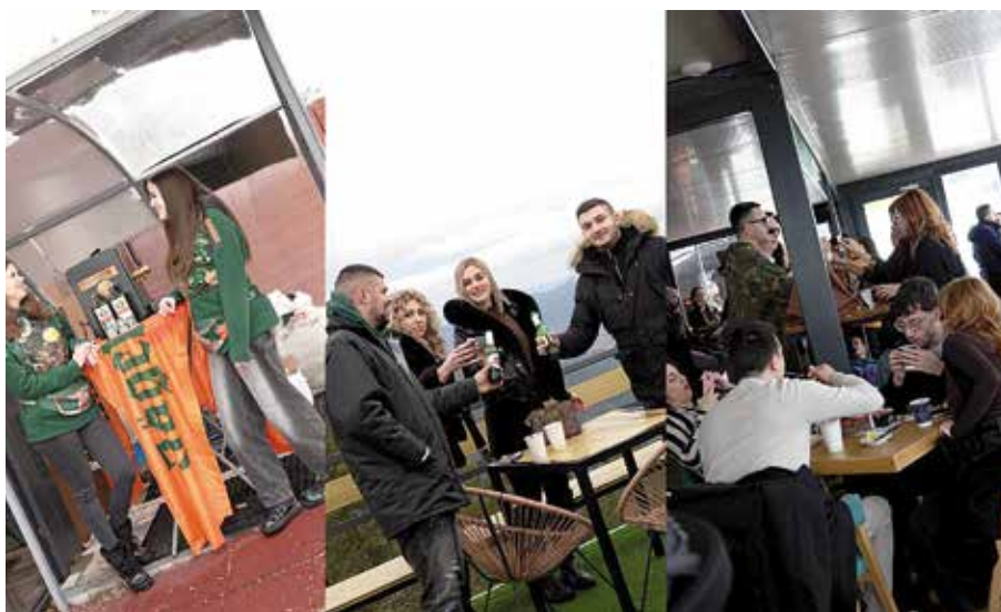
Матине на гондоли