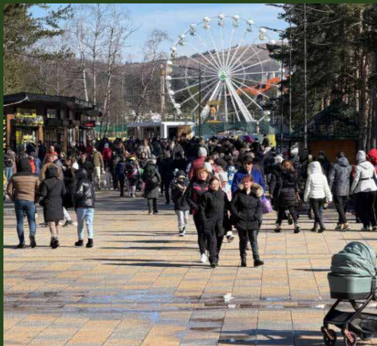
Препун Краљев трг

Посебна пажња посвећена је новој промотивној кампањи „Желим за себе“, чији је циљ снажније повезивање потенцијалних гостију са дестинацијом, уз активно укључивање хотелског и смештајног сектора. Учесници састанка упознати су и са активностима водичке службе Туристичке организације Златибор, која представља додатну вредност укупној понуди дестинације. У наредном периоду туристички води-