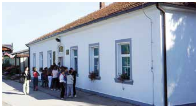
Школа у Мачкату

Председник општине упутио је апел мештанима Мачката и околних подручја да помогну у решавању имовинских односа, нагласивши да су инфраструктурни пројекти, попут постројења за прераду отпадних вода, главног колектора и секундарне мреже, у интересу самих домаћинстава и месних заједница.