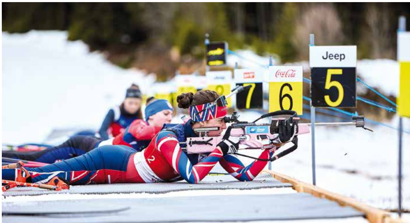
Српске такмичарке на стрелишту

Српске биатлонке сада се окрећу новом великом испиту, јер их крајем месеца очекује наступ на Светском јуниорском првенству у биатлону у Немачкој, где ће имати прилику да се надмећу са најбољим младим биатлонцима света и потврде добру форму са Балканског првенства.