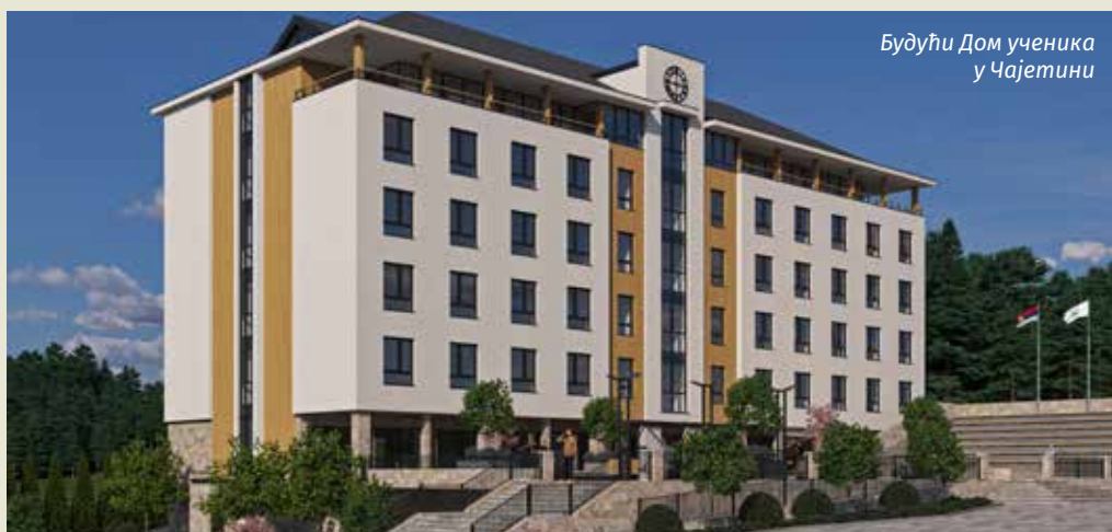
Будући Дом ученика у Чајетини

– Ту су почели грађевински радови на градњи неколико спортских терена. Праве се терен за фудбал (40 x 20 м) са вештачком травом, кошаркашки терен (28 x 15 м) и одбојкашки терен (18 x 9 м), као и атлетска стаза за истрчавање дужине 70 метара. Терени за кошарку, одбојку и атлетска стаза биће прекривени мултифункционалном подлогом. Започели су радови и на изградњи јавне расвете, рефлектора за ноћно осветљење спортских терена и видео надзору за безбедност деце на спортским теренима.