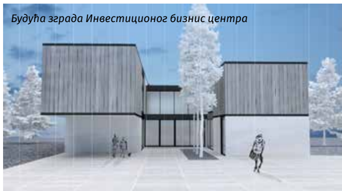
Будућа зграда Инвестиционог бизнис центра

Визија је да постане регионални развојни центар иновација и иновативног предузетништва. Планира да развије пет иновативних компанија по моделу јавно-приватног партнерства. Кроз сарадњу са универзитетима, истраживачким центрима и другим организацијама идеја је да се оствари интеграција са међународним и домаћим институцијама. Један од кључних инфраструктурних пројеката је завршетак зграде Иновационог бизнис центра, а планира се завршетак изградње у наредних пет година, што ће бити основа за привлачење пословних људи, компанија и других организација из земље и дијаспоре. Зграда ће пружити модерне просторије за рад, образовање, а очекујемо да се већина наших младих и образованих људи врати, остане и ради у општини Чајетина.