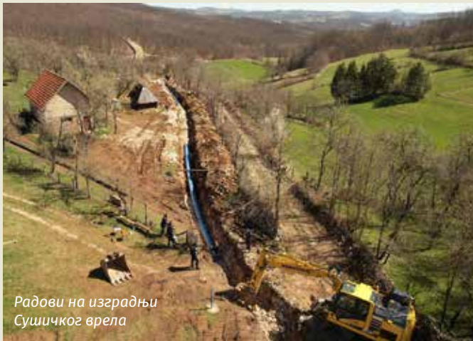
Радови на изградњи Сушичког врела

били). Тако да је ово потпуна инвестиција општине Чајетина, 17 километара цевовода. Морам да кажем да је наш цевовод од Рибничког језера до Златибора пет километара, а ми смо и ту променили старе бетонске цеви новим дуктилним које смо увезли из Турске, што је савремен и дуготрајан материјал. Ово су, дакле, врло озбиљни и важни послови, за наредне векове".