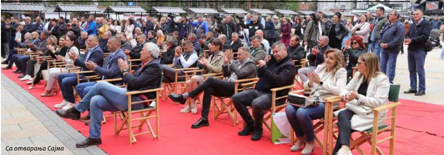
Са отварања Сајма

НА ЗЛАТИБОРУ ОДРЖАН ПРВИ МЕЂУНАРОДНИ САЈАМ ПОЉОПРИВРЕДЕ И РУРАЛНОГ ТУРИЗМА