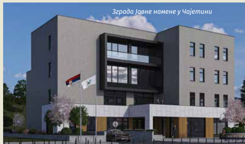
Зграда Јавне намене у Чајетини

"Ученички дом ћемо правити на иницијативу средње Угоститељско-туристичке школе и родитеља који долазе и овде уписују децу, па имају проблем где да им се деца сместе. На Златибору су станови скупи, а у Чајетини је мање капацитета за издавање. То је разлог због кога смо се определили да ради-