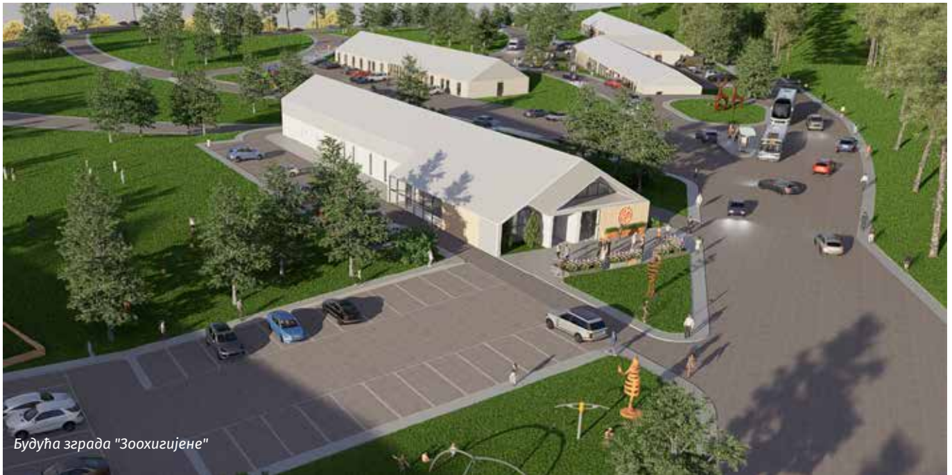
Будућа зграда "Зоохигијене"

Јавно предузеће "Зоохигијена Чајетина" основано је одлуком одборника СО Чајетина почетком 2023. године. У првим месецима рада предузећа спроведене су све неопходне процедуре и процеси за законски и организован рад предузећа, а потом се приступило обезбеђивању просторних и кадровских капацитета предузећа. До октобра исте године постављен је, монтиран и у потпуности опремљен објекат Ветеринарске амбуланте за кућне љубимце, који је у функцији.