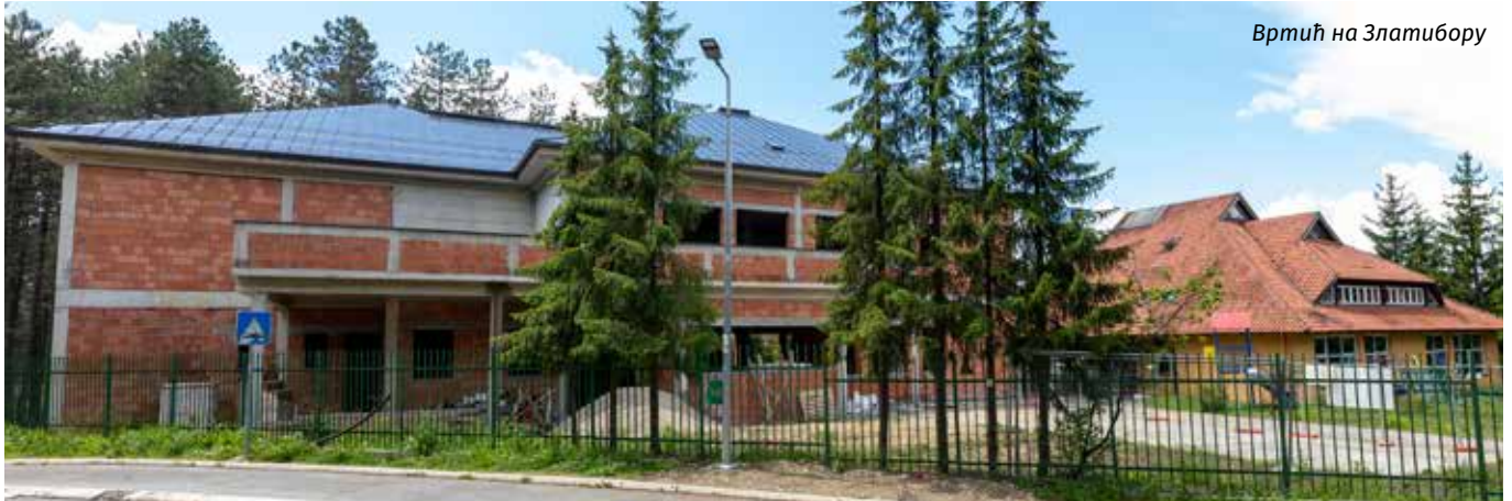
Вртић на Златибору

З начајне инвестиције Предшколске установе "Радост" започете су 2020. године партерним уређењем испред објекта на Златибору.