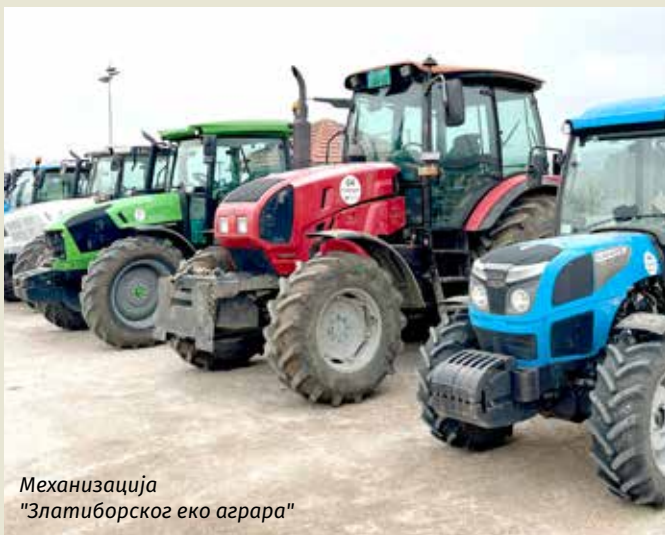
Механизација "Златиборског еко аграра"

Тако ће Чајетина у том делу изгледати потпуно другачије, јер на самој Главици у лепој боровој шуми планирамо да направимо бројне спортске терене и садржаје, играонице за децу, адреналин парк, одморишта, чесме и друго. Да тај део потпуно оживимо, а очувамо оно што вреди".