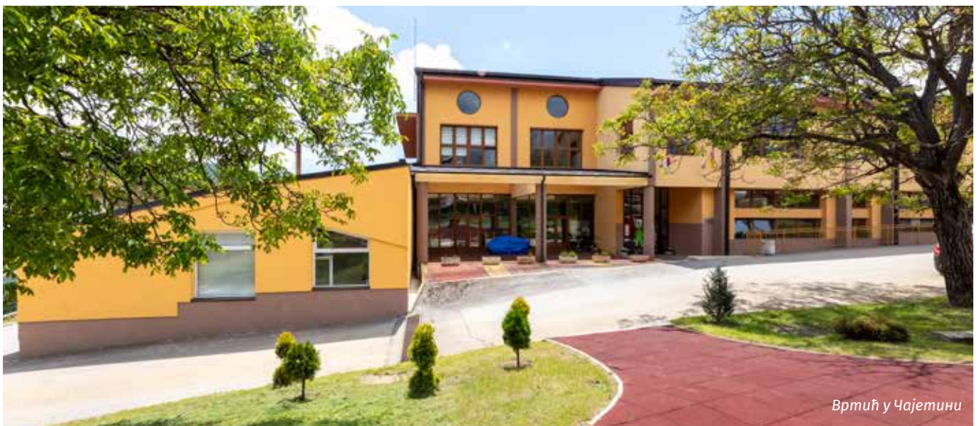
Вртић у Чајетини

ди истаћи наставак инвестирања у завршетак објекта вртића на Златибору, као и адаптацију и проширење капацитета вртића у Сирогојну. За вртић у Сирогојну потписан је уговор са Министарством просвете у који ће бити инвестирана око 3,5 милиона динара из кредита Светске банке, с тим што ће општина Чајетина партиципирати у том пројекту за радове који нису обухваћени овим пројектом, а односе се на отварање новог посебног улаза у вртић, део фасаде, и друго. На тај начин ће се испоштовати стандарди простора обавезујући за установе у којима бораве деца предшколског узраста и у којима се спроводе предшколски програми.