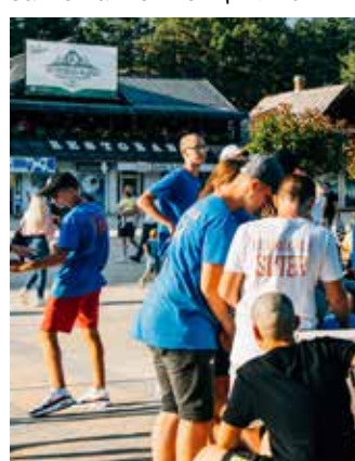
Језеро на Златибору