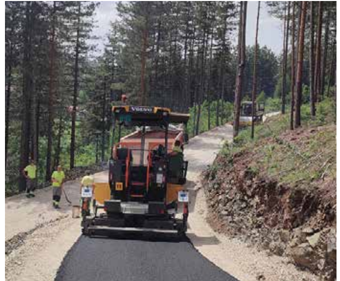
Пешачка стаза на Главица

У циљу унапређења спортске инфраструктуре и промоције здравог начина живота, у току је изградња два нова спортска терена на две локације у насељеном месту Чајетина. Ова иницијатива, потекла од локалне самоуправе, представља значајан корак ка стварању бољих услова за рекреативне и професионалне спортисте, као и за све грађане који желе да се баве физичком активношћу.