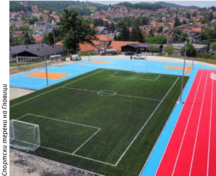
Спортски терени на Главица