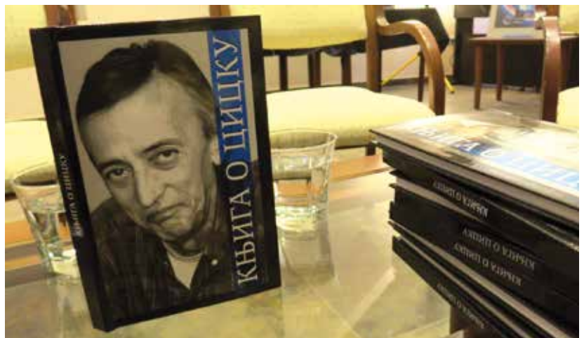
Промоција Књиге о Цицку