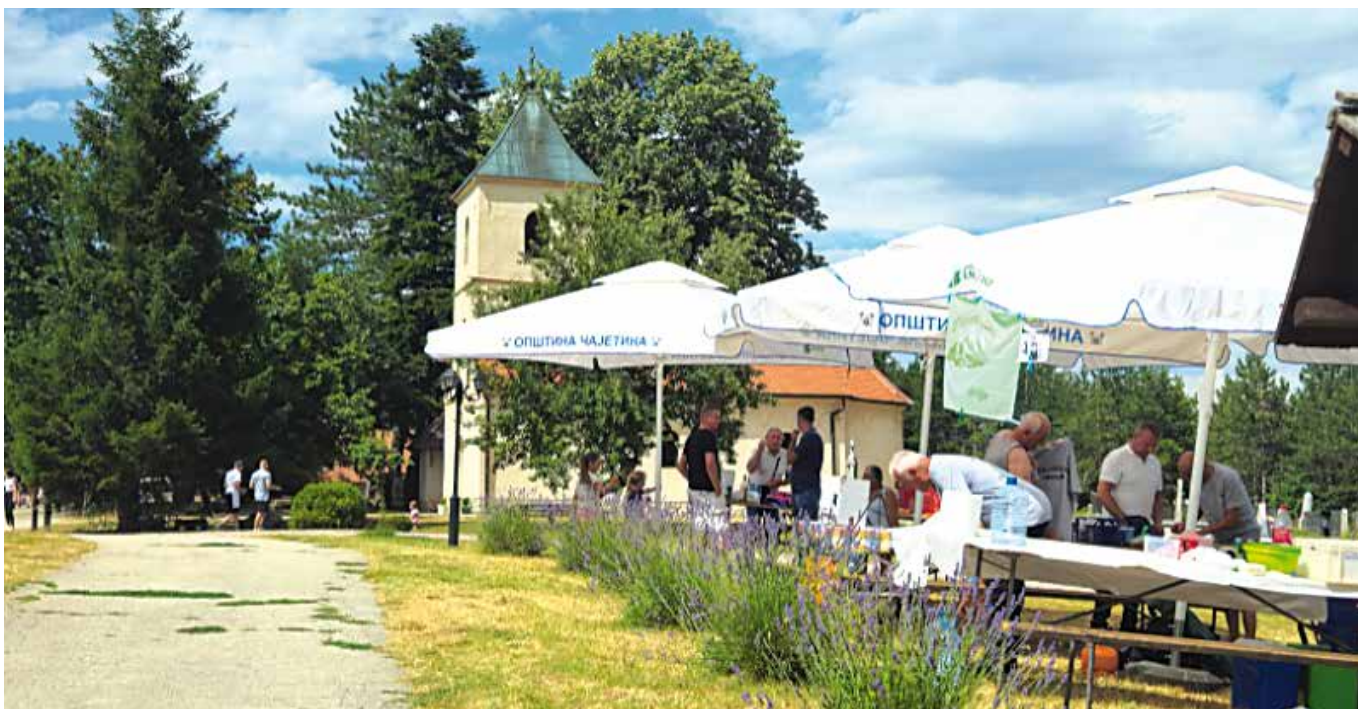
Петровдански дани у Сирогојну

Традиционална манифестација „Петровдански дани“ у златиборском селу Сирогојну одржана је у знаку хуманости, традиције и забаве. Програм је отпочео Литургијом у Цркви Светих апостола Петра и Павла, обележавајући сеоску славу. Посетиоци су имали прилику да закораче у прошлост златиборског округа и истраже аутентични Музеј „Старо село“ у Сирогојну, који се налази у непосредној близини Цркве Светих апостола Петра и Павла.