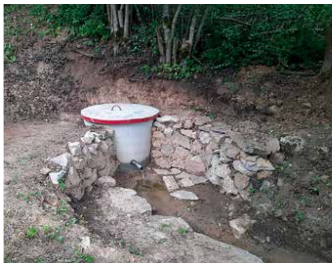
Извор у Трнави

Општина Чајетина подржава овакве иницијативе и истиче важност заједничког рада на заштити и унапређењу животне средине.