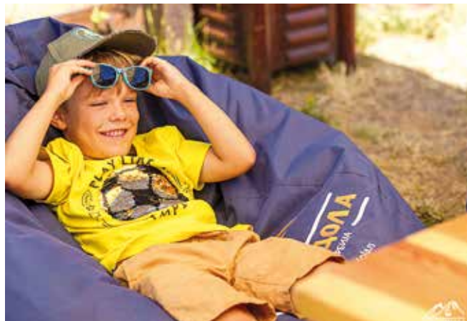
Дечји дан на Гондоли

Паметно, разиграно и незаборавно лето на Голд гондоли, позива све малишане и родитеље да нам се придруже у авантури знања, игре и креативности, видимо се на висини.