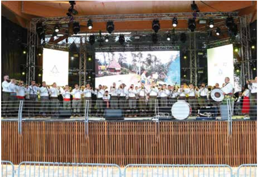
Учесници Сабора трубача

Свечани дефиле оркестара одржан је у вечерњим сатима на Краљевом тргу, након чега је у 20 часова започело такмичење под називом „Златиборе, мој зелени боре“.