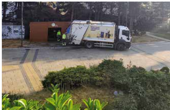
Комунална служба на терену

У току је и изградња сопствене асфалтне базе