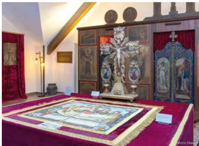
Изложба у Библиотеци

Изложба је подељена у три сегмента. У првом је преглед историјата храма о кључним моментима и актерима, у другом су изложени предмети који су раније коришћени у богослужењима и обредима, а трећи део је реконструисан олтар са оригиналним иконама које су раније биле у цркви.