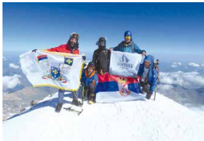
Планинари на Елбрусу

Успон на Елбрус захтева изузетну физичку спремност, озбиљну припрему и тимску сарадњу, а чланови ПК „Торник“ показали су управо те вредности – истрајност, храброст и љубав према планини.