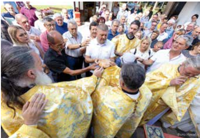
Прослава јубилеја Храма

Уз молитвени тон звона и мирис тамјана, у Храму Светог Архангела Гаврила у Чајетини служена је света литургија поводом храмовне славе. Велики број верника, мештана и поштовалаца духовне традиције окупили су да заједно са свештенством прослави овај велики празник, један од најважнијих за чајетински крај.