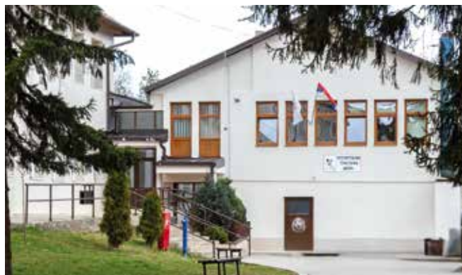
Угоститељско - туристичка школа

Циљ пројекта је јачање националног идентитета младих из дијаспоре и региона, очување културног наслеђа и повезивање са матицом.