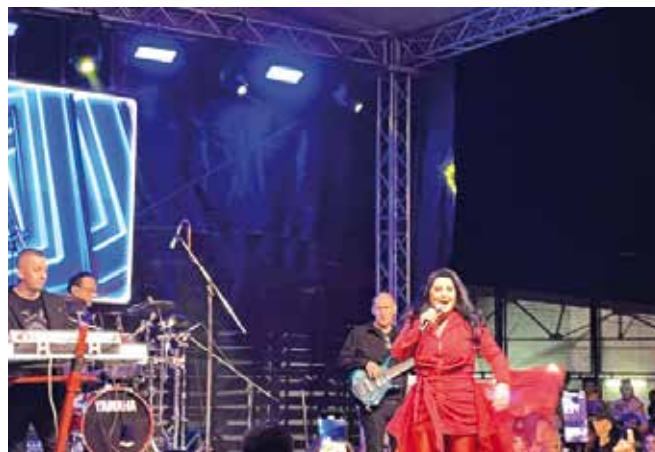
Концерт Драгане Мирковић

Организатори манифестације „Петровдански дани“ су ТУ Сирогојно, по покровитељством Општине Чајетина, подржана од стране Министарства за бригу о селу Републике Србије у оквиру манифестације „Михољски сусрети села“, уз помоћ: Туристичке организације „Златибор“, Сирогојно Компани, Старо село Сирогојно, КЦ „Златибор“ Чајетина, ТРК „Златибор“, Спортски савез Чајетина, Одмаралиште „Вива спорт“ Сирогојно.