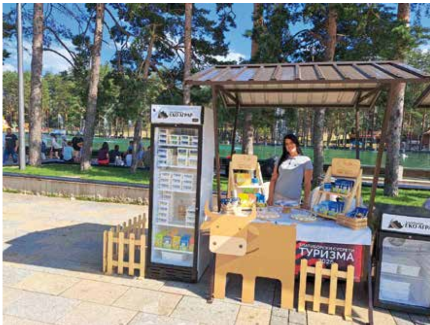
Еко аграр на Сусретима туризма

Током јула месеца, Златиборски Еко аграр био је снажно присутан на терену, али и у срцу две важне манифестације које су окупиле велики број туриста, произвођача и љубитеља домаћих производа. Кроз промоцију млекаре "Наша Златка", учешће на догађајима и низ конкретних активности, наставили смо своју мисију повезивања села, туризма и локалне производње.