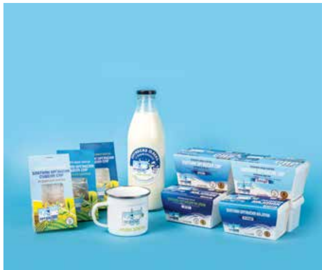
Ново паковање производа

Овог лета представљена је и нова амбалажа органских производа млекаре "Наша Златка", дизајнирана тако да одражава природност, чистоћу и локални идентитет, нова амбалажа је већ препозната међу потрошачима као симбол поверења и квалитета. Тиме се додатно истиче посвећеност стандардима органске производње и транспарентности према крајњим купцима. Нова амбалажа није само естетски привлачна – она је еколошки безбедна, практична и потпуно усклађена са савременим стандардима заштите животне средине. Материјали који се користе у паковању су биоразградиви и рециклабилни, безбедни за директан контакт са храном и без штетних адитива. На тај начин, чувамо не само укус производа, већ и здравље потрошача и природу из које производи потичу.