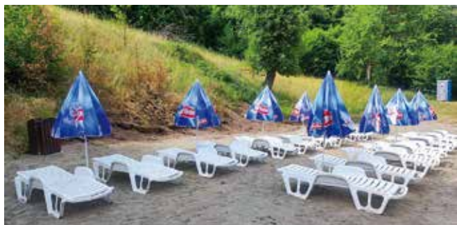
Плажа у Дренови

Подршку пројекту пружили су Општина Чајетина и јавна предузећа, а ово купалиште представља нову понуду у оквиру летњег туризма на Златибору.