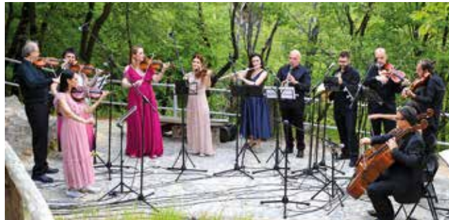
Концерт у Гостиљу