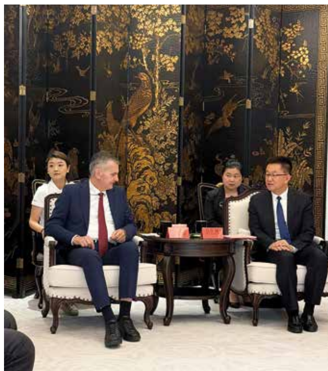
Са кинеским партнерима

Потписивањем споразума о братимљењу општина Чајетина се повезује са једном од најразвијенијих и енергетски најмоћнијих регија Народне Републике Кине, чији ресурси и искуства представљају огроман потенцијал за заједнички напредак.