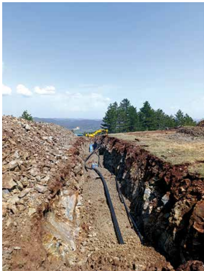
Радови на новом водосистему

„У овом периоду године, на пример, вода на изворишту је толико чиста да би степен прераде био мини-