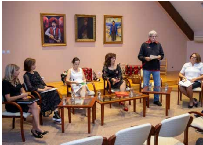
БИБЛИОТЕКА „ЉУБИША Р. ЋЕНИЋ“