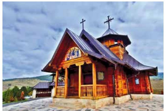
Црква у Драглици