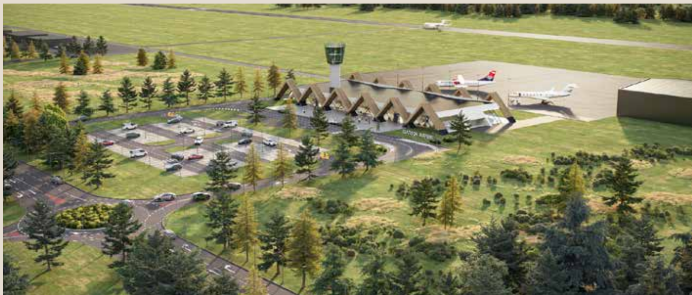
Будући изглед аеродрома (Архитектонско решење А3 Architects)