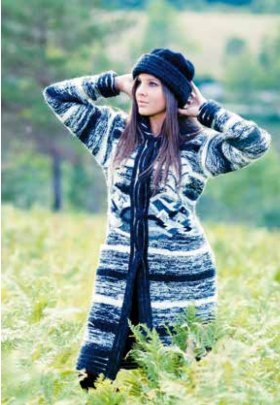
Сирогојно џемпери - традиција дуга 60 година