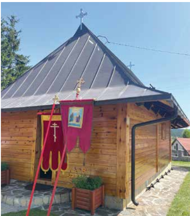
Црква у Семегњеви

У селу Семегњеви, недалеко од Чајетине, 1927. године подигнута је црква брвнара посвећена Рођењу