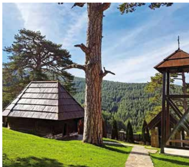
Црква у Доброселици

године, али је више пута рушена и поново подизана. Данашњи облик добила је 1821. године, када су је мештани пренели на безбедније место. Унутрашњост красе две престоње иконе – Господа Исуса Христа и Богородице са Дететом, украшене барокним крунама. Оне су изузетна уметничка дела која сведоче о утицајима западног стила на српско иконописно наслеђе. Иако је велики део старих рукописа уништен у светским ратовима, црква је остала место сабрања и молитве, као и омиљена дестинација туриста који обилазе златиборске светиње.