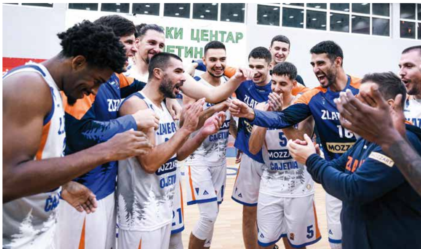
Екипа КК Златибор