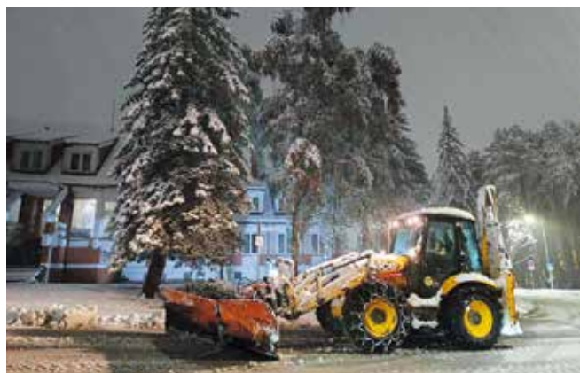
Механизација на терену

Поред наведених, у току месеца реализоване су и редовне активности других служби – изградња нових и одржавање постојећих локалних путева, одржавање јавне расвете, акција пошумљавања, као и наставак радова на изградњи рециклажног дворишта, једног од најважнијих пројеката у области управљања отпадом.