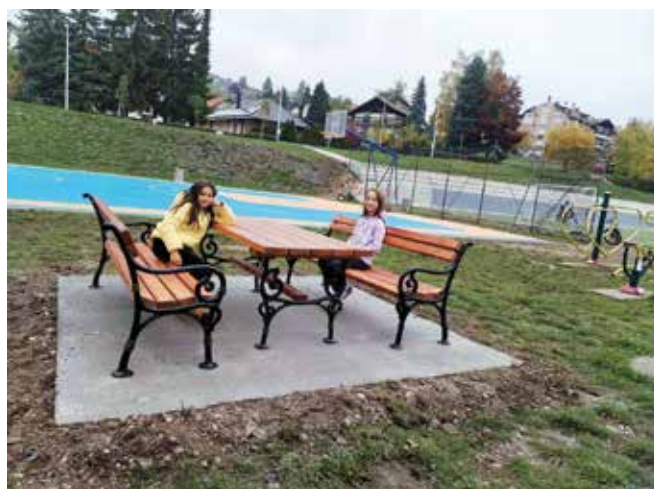
Нови мобилијар у Чајетини

Претходни месец обележиле су бројне активности екипа Комуналног јавног предузећа „Златибор“ због првог снега који је захватио шире подручје Златибора, одржавање и уређење јавних површина, као и еколошке иницијативе у домаћинствима кроз програм компостера. Службе су имале пуно посла због мокрог и тешког снега који је изазвао обарање стабала, али су сви путеви били проходни. Након тога покренута је и акција сакупљања поломљених грана уз помоћ грађана и механизације предузећа.