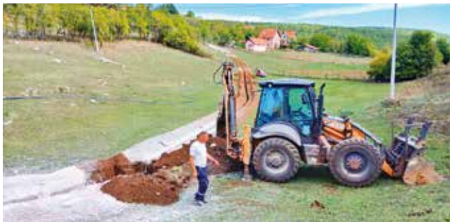
Радови на краку водовода у Шљивовици

Посебан акценат током овог периода стављен је и на екологију. Запослени у предузећу учествовали су у акцији пошумљавања, свесни да брига о води почиње бригом о земљи и природи. Свако посађено дрво за њих је симбол дугорочног улагања у здравље заједнице.