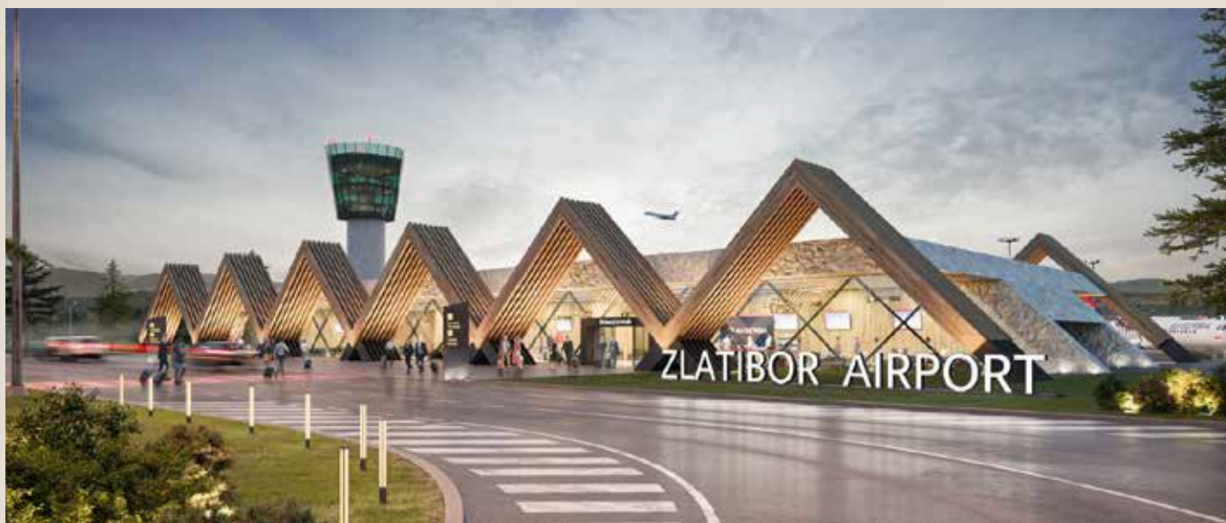
Златиборска ваздушна лука (Архитектонско решење A3 Architects)

У техничком смислу, ово је најкомплекснији аеродромски пројекат у Србији у последњој деценији, са потенцијалом да постане регионални хаб за туризам, логистику и рурални извоз, уз примену најсавременијих стандарда у изградњи и управљању.