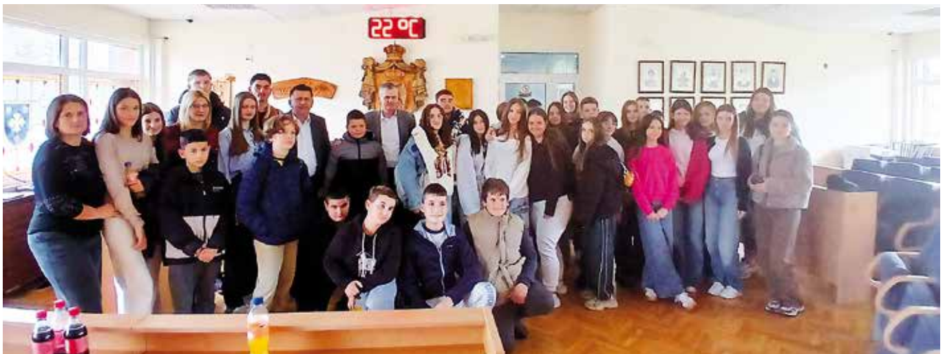
Млади парламентарци са представницима локалне самоуправе

На крају је позвао све учеснике скупа да се укључе у рад Канцеларије за младе која је отворена за младе свих узраста и где могу да кроз волонтерски рад, пројекте и хуманитарне активности учествују у обликовању заједнице у којој живе.