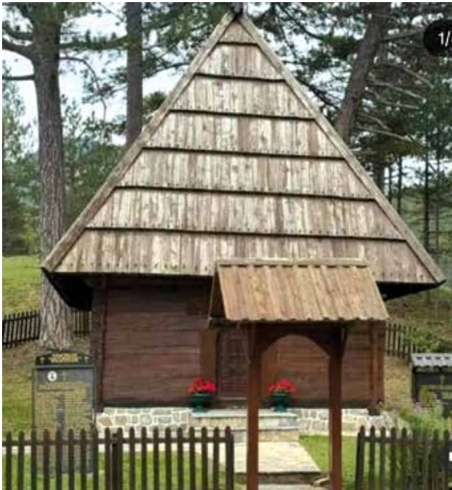
Црква у Јабланици

атракција постао је све чешће посећиван локалитет на Златибору и рецепт за очување културног и историјског идентитета нашег народа.