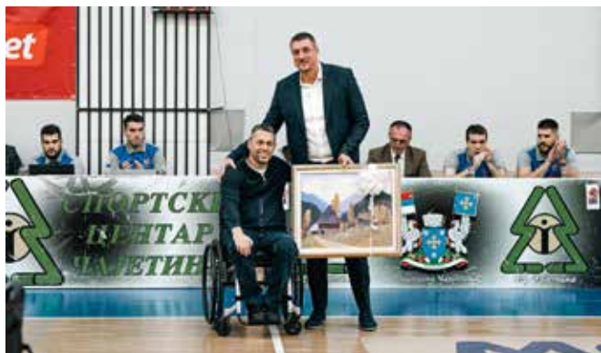
Поклон од КК Златибор