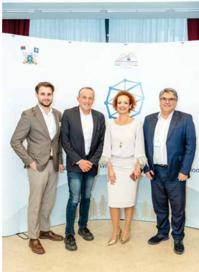
Гости Првог Гондола форума

„Гондоле су постале симбол нових вредности у туризму – баланса између развоја, екологије и локалне традиције. Први Гондола форум отворио је простор за сарадњу и инспирисао нас да заједно градимо планинске дестинације будућности. Жеља нам је била да окупимо на једном месту представнике гондола, жичара, заинтересованих страна из других општина и других организација који су везани за гондоле које раде целе године. Препознала сам заједно са својим сарадницима да се туристичке гондоле, гондоле које раде целе године, разликују прилично од оних скијашких гондола, што смо имали прилике да чујемо и током панела. Као што смо чули на једном панелу, постоје урбане, туристичке, скијашке гондоле и све оне имају неке своје карактеристике, а опет све се оне између себе разликују. Сматрали смо из Голд гондоле да би на једном месту