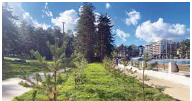
Дрворед код језера

Ово је само једна у низу акција општине Чајетина која се спроводи у оквиру шире стратегије еколошке заштите – на подручју Златибора је у досадашњим акцијама у сарадњи са Парком природе „Златибор“ и Комуналним јавним предузећем „Златибор“ до сада засађено више од 75.000 садница различитих врста.