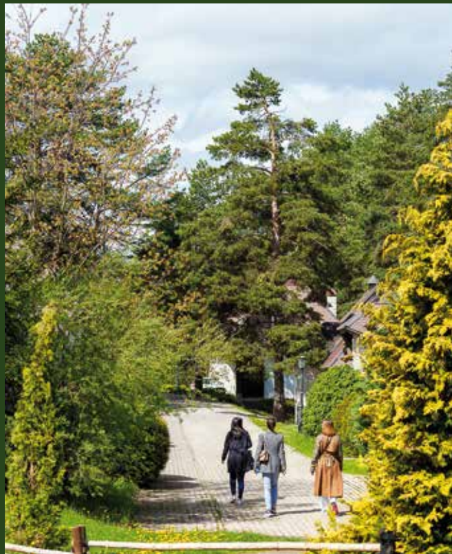
Јесен на Златибору