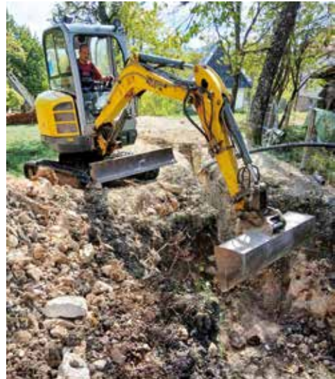
Радови у Шљивовици

Истовремено, изграђен је нови водоводни крак који из Шљивовице води ка насељима Војиновићи и Лазовићи, чиме је решен вишегодишњи проблем за око 15 домаћинстава у Бранешцима. За те породице, вода из чесме више није луксуз, већ свакодневна стварност – симбол повезаности и