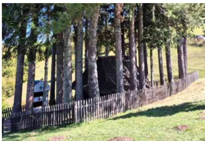
Црква у Пети