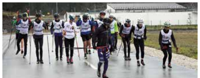
Трка у нордијском скијању