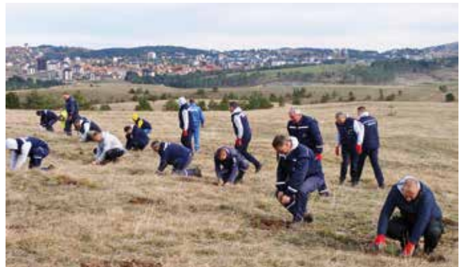
Акција пошумљавања на Бреговима