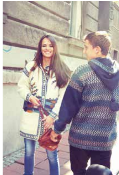
Џемпери који су обишли свет

Највећи изазов је носити одговорност за велики број запослених. Бити предузетник значи свакодневно решавати реалне проблеме људи. Поред тога, политички утицаји на привреду, као и нетранспарентно регулисано тржиште (нпр. сукоби произвођача и прерађивача малине), отежавају рад. Већ 22 године упозоравам на потребу укључивања науке у решавање проблема у пољопривреди.