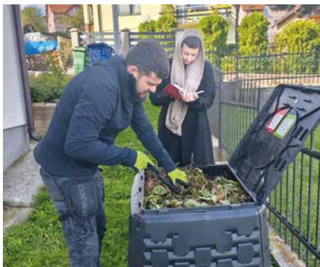
Теренска посета корисницима компостера

Након што се време пролепшало, настављено је са уређењем јавних површина у Чајетини. Постављен је нови парковски мобилијар на више локација – клупе, столови, клацкалице, љуљашке и њихалице – стварајући пријатније и функционалније просторе за одмор, дружење и рекреацију. Нови мобилијар део је плана општине за побољшање урбаног амбијента и подстицање активности на отвореном.