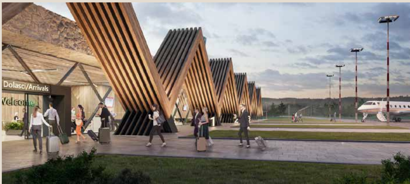
Зграда терминала (Архитектонско решење A3 Architects)

Изградња аеродрома на Златибору представља један од најзначајнијих инфраструктурних подухвата у овом делу Србије, са потенцијалом да дубински трансформише туристичку, економску и логистичку слику региона. Пројекат је у напредној фази припреме, а очекује се да ће грађевинска дозвола бити издата током наредне године, чиме би се створили услови за почетак радова.