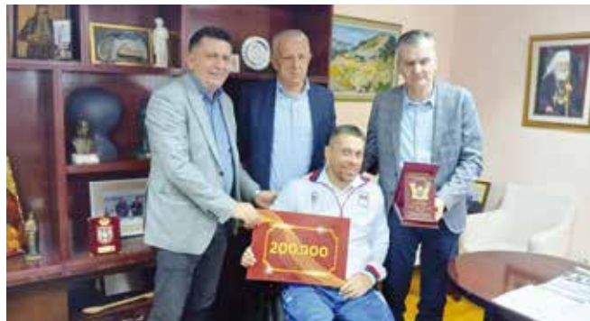
Пријем у Општини

узетном успеху, наглашавајући значај који његов резултат има, не само за српски спорт, већ и за углед и понос општине Чајетина.